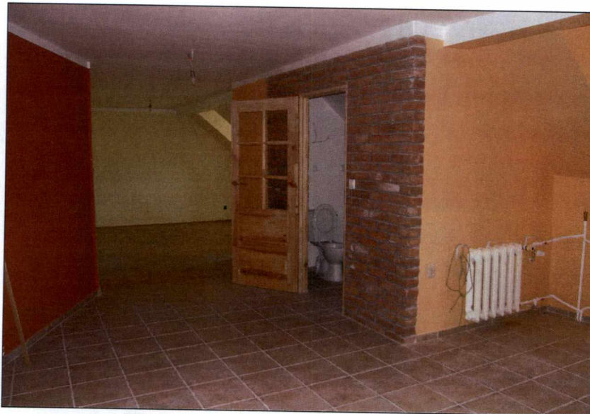
Wnętrza – widok od strony wejścia do lokalu