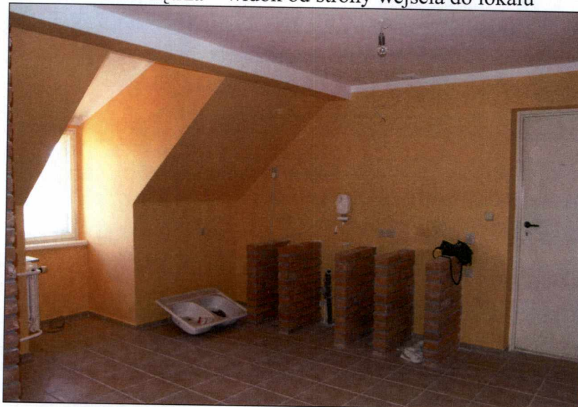
Wnętrza - kuchnia