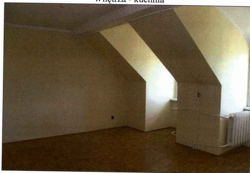
Wnętrza - pokój